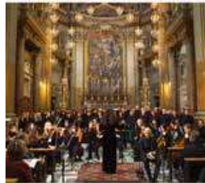
(Suite pages 6 et 7)

Le chœur italien Troubar Clair de Bordighera , accompagné de 30 musiciens de l'orchestre Note Libere de Riviera dei Fiori , interpréteront en notre honneur et pour la 1 ère fois en France, après les Etats-Unis et Rome, la composition du Maître de Chapelle américain Michael John Trotta : « Septem Ultima Verba ». Cette œuvre contemporaine, à la fois facile d'accès et puissante, est un véritable baume au cœur.